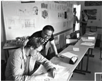
Lycée technique Honfleur